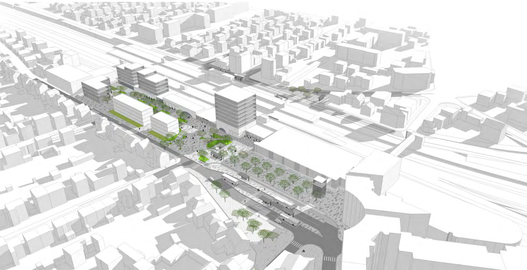
Pôle de la gare de Bondy